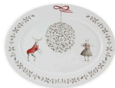
NOEL LARGE OVAL PLATTER €88.00