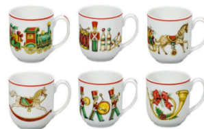
CHRISTMAS MAGIC SET OF 6 MUGS €150.00