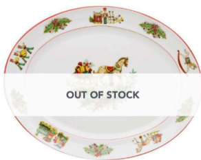
CHRISTMAS MAGIC, MEDIUM OVAL PLATTER €89.00