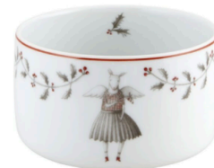
NOEL, BOWL 28 CL €22.50