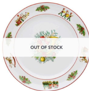
CHRISTMAS MAGIC, FLAT ROUND PLATTER €89.00