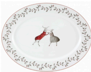
NOEL MEDIUM OVAL PLATTER €73.00